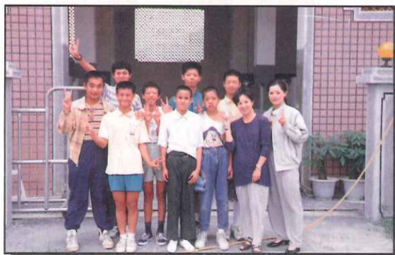
體衛組召集之本校環保尖兵