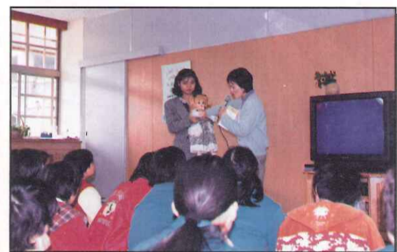
訓導室、輔導室合辦性教育講座