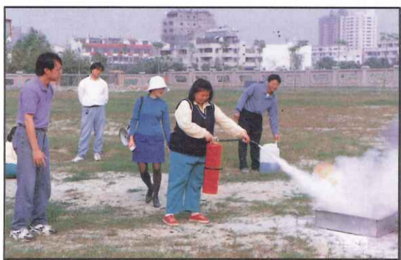
訓導處辦理防災演習