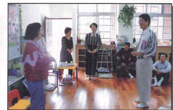
輔導室辦理週日父母成長活動