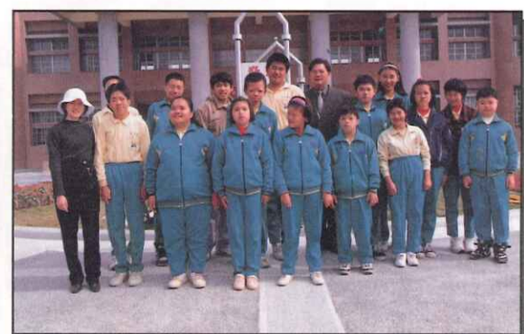
本校模範生與校長合影