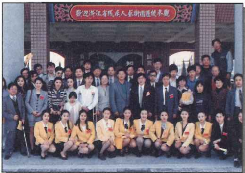
浙江殘疾人士藝術團蒞臨本校參觀